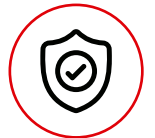
SISTEMA DE SEGURIDAD MURPHY