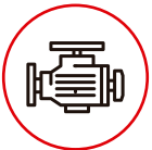
MOTOR CUMMINS 450BHP