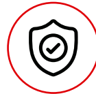
SISTEMA DE SEGURIDAD MURPHY